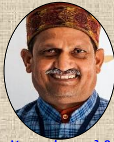
डॉ. उमाशंकर पचौरी